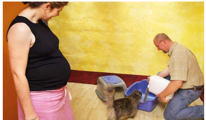
In uitwerpselen van (vooral jonge) katten kan toxoplasma zitten. Verschoon daarom niet zelf de kattenbak.

Dieren op de (kinder)boerderij kunnen ziekteverwekkers bij zich dragen die ook voor mensen gevaarlijk kunnen zijn. Raak dieren, hooi, stro en mest bij voorkeur zo min mogelijk aan en was uw handen met zeep en veel water na contact met dieren. Eet niet tussen de dieren en eet geen voedsel dat op de grond is gevallen. Veeg uw voeten bij vertrek zodat u geen mest onder uw schoenen mee naar huis neemt.