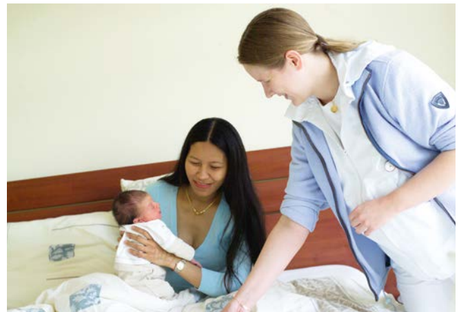
De kraamverzorgster voert elke dag controles uit bij u en uw baby, zodat een eventuele infectie tijdig wordt herkend.

Ja, het geven van borstvoeding is onschadelijk voor het kind en bevordert het genezingsproces. Overleg met uw verloskundige of huisarts als de klachten aanhouden. Heeft u een borstontsteking en daarnaast ook koorts? Neem dan contact op met uw huisarts.