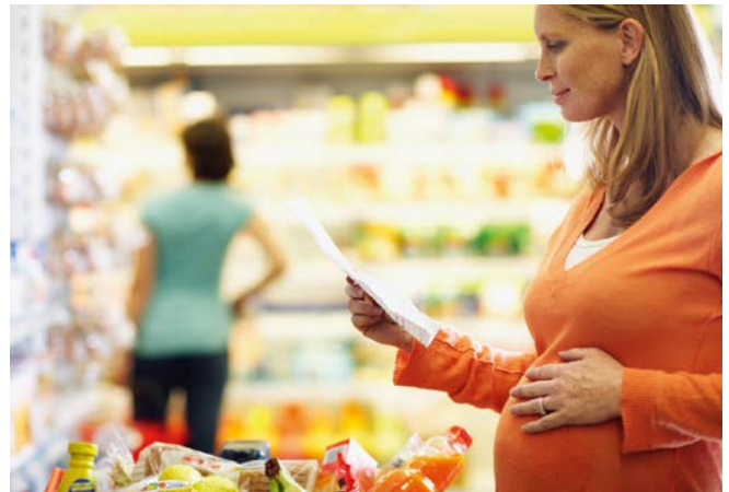
Door zorgvuldig te letten op wat u eet, beschermt u uw kind.