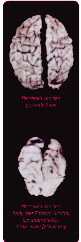
Hersenen van een gezonde baby

Tijdens de zwangerschap worden cellen aangemaakt waarmee lichaamsdelen, hersenen en andere organen groeien. Wanneer je alcohol drinkt tijdens de zwangerschap, kun je de aanmaak van die cellen verstoren. Hierdoor is het mogelijk dat sommige delen van het lichaam van je kindje niet goed groeien. Of je beschadigt organen bij je baby die al ontwikkeld zijn. Vooral de hersenen zijn kwetsbaar: die blijven de gehele zwangerschap in ontwikkeling. Daarom kan alcoholgebruik tijdens ieder moment van de zwangerschap voor hersenschade zorgen. Bij een kind kun je dan afwijkingen zien, zoals een lager IQ, leerproblemen, hyperactiviteit of gedragsproblemen.