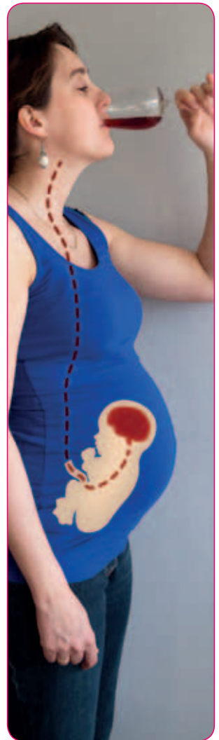
Als je alcohol drinkt, drinkt je baby mee.