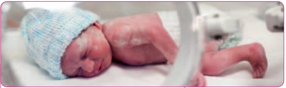
Baby in couveuse